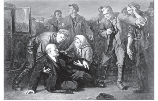
◆ «Покушение на В.И. Ленина в 1918 г.» Худ. П. Белоусов.

— Действительно, есть важные вопросы, на которые стоило бы помочь читателям верно ответить. Сегодня в связи со 100-летием памяти В.И. Ленина мне хочется авторитетным мнением подтвердить его роль в качестве одного из крупнейших мировых политических пророков. Мнение это принадлежит ушедшему из жизни в 2019 году видному американскому учёному Иммануилу Валлер-