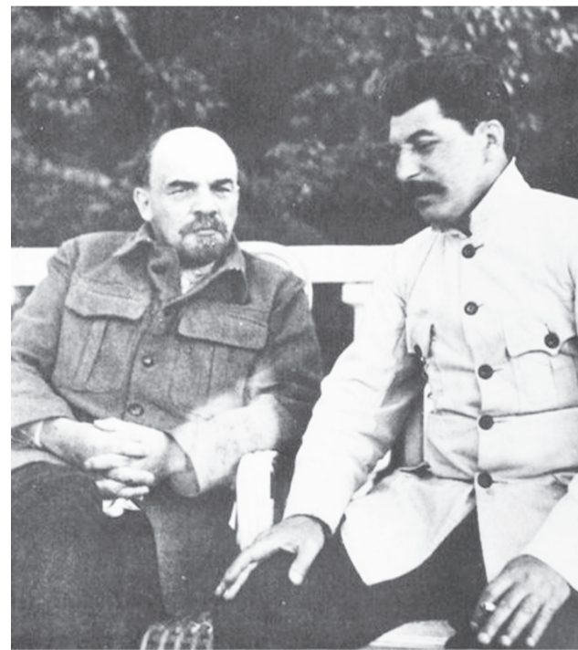
◆ В.И. Ленин и И.В. Сталин на террасе в усадьбе Горки. 1922 г.

Сообразно с выводом о переходе капитализма в фазу господства крупного монополистического капитала и диагностирования завершения капиталистического раздела мира делалось заключение о неизбежности военной эскалации и мировых войн. Война, резюмировал свой анализ Ленин, заложена в самой природе капитализма. Чтобы искоренить войну, рассуждал он далее, требуется упразднить капитализм.