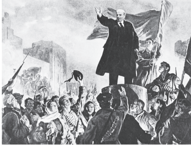
◆ Ленин на броневике в апреле 1917 г. Автор публикации А.И. Гудков.

Пропанганда мира в настоящее время, не сопровождающаяся призывом к революционным действиям масс, способна лишь сеять иллюзии, развращать пролетариат внушением доверия к гуманности буржуазии и делать его игрушкой в руках тайной дипломатии воюющих стран. В частности, глубоко ошибочна мысль о возможности так называемого демократического мира без ряда революций».