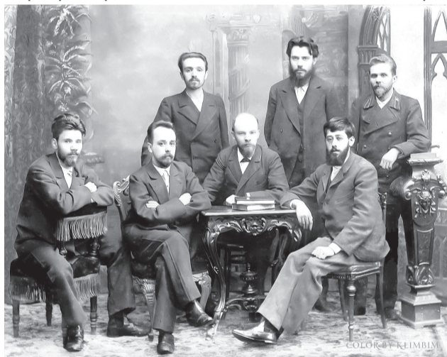
◆ Ульянов среди членов петербургского «Союза борьбы за освобождение рабочего класса». 1897 г.

Ленин оказался непревзойдённым политиком. Он выдвинул всего пять лозунгов: «Мир народам!», «Хлеб голодным!», «Земля крестьянам!», «Заводы и фабрики рабочим!», «Власть Советам!». И стра-