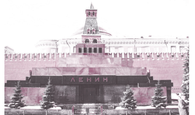
◆ Мавзолей Ленина на Красной площади в Москве.

— Валлерстайн, конечно же, обращал внимание на недостойное принижение и искажение роли Ленина в нашей стране за последние годы. И он был убеждён, что переосмысление ленинских заслуг в качестве выразителя российского вектора мирового исторического процесса неизбежно придёт. Где-то к 2050 году, прогнозировал американский мыслитель, Ленин вновь окажется главным национальным героем России, но уже в новой акцентировке борьбы за место среди держав в мировой системе.