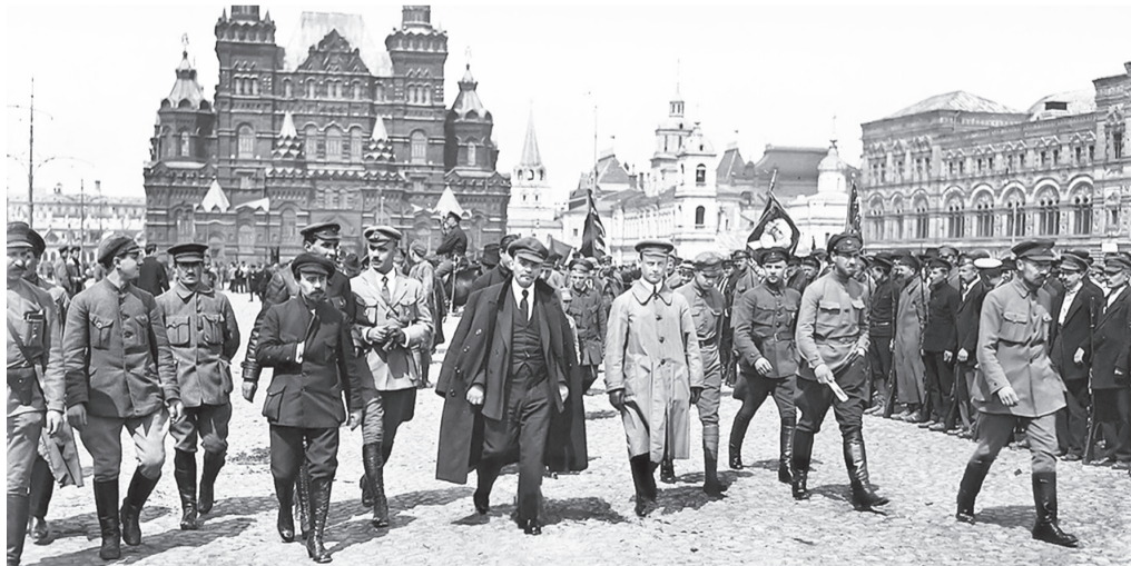
◆ Ленин на параде войск Всевобуча (всеобщее военное обучение), Москва, 25 мая 1919 г.

Сейчас перед нами стоит исключительно ответственная задача. Нужна сплочённость, прежде всего, народно-патриотических сил во главе с Компартией.