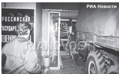
◆ У телецентра Останкино.

Сегодня очевидно, что вёдшиеся в последние дни сентября переговоры о «нулевом варианте»