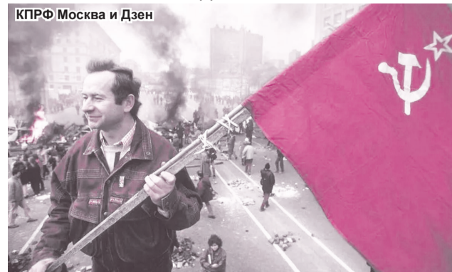
КПРФ Москва и Дзен