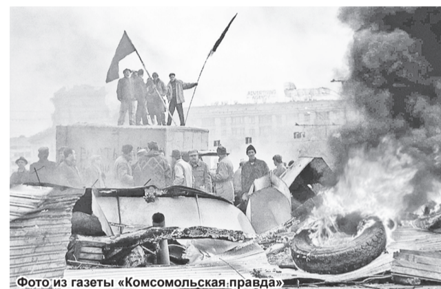
Фото из газеты «Комсомольская правда»

12 декабря 1993 года было проведено всенародное голосование по принятию новой Конституции в соответствии с «Положением о всенародном голосовании», утверждённым указом Ельцина. В тот же день прошли выборы депутатов в Государственную Думу и Совет Федерации — палаты нового парламента, который должен был возникнуть в случае одновременного принятия Конституции, в заключительных положениях которой и оговаривались сами эти выборы. Однако проведение это-