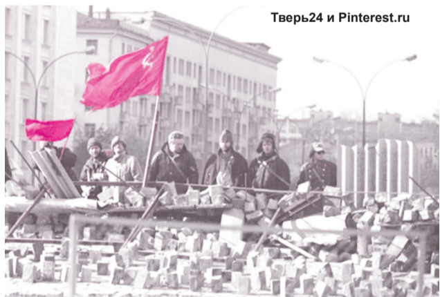
Тверь24 и Pinterest.ru

К началу 1993 года после радикальных реформ правительства Ельцина — Гайдара социально-экономическая ситуация в России находилась в тяжёлом состоянии: за год цены выросли в 26 раз, а покупательная способность вкладов населения уменьшилась на 94%. Съезд народных депутатов и Верховный Совет были всё больше недовольны результатом реформ и способом их проведения. Ситуация усугублялась наличием поста президента при сохранении неограниченных полномочий Съезда народных депутатов и Верховного Совета, что порождало в России проблему двоевластия. В то же время Ельцин настаивал на передаче полномочий Съезда народных депутатов президенту.