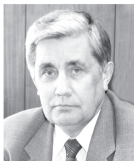
Депутат Государственной Думы Российской Федерации

ТАКАЯ ПРОГРАММА БЫЛА ПРЕДСТАВЛЕНА НАРОДУ КОММУНИСТИЧЕСКОЙ ПАРТИЕЙ РОССИЙСКОЙ ФЕДЕРАЦИИ.