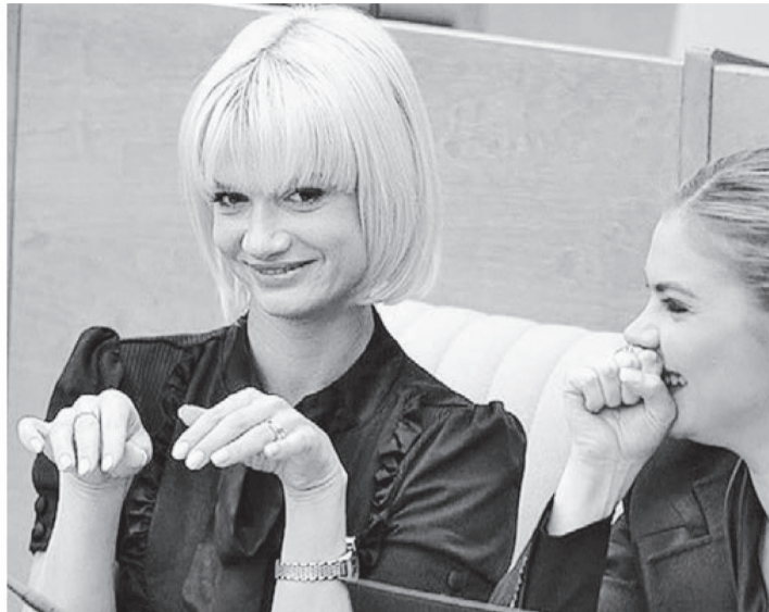
Депутаты-гимнастки-единороссы Светлана Хоркина и Алина Кабаева на пленарном заседании Госдумы.

18 СЕНТЯБРЯ предстоят очередные выборы в Госдуму и региональные парламенты. И снова партия власти «Единая Россия», не к ночи будь помянута, пытается спрятать свою антинародную сущность за именами известных в народе спортсменов, космонавтов, артистов и телеведущих. Только в Подмосковье от этой партии будут пытаться избраться аж два космонавта, один хоккеист и две фигуристки... И ничего, что все они не проживают в соответствующих избирательных округах. И ничего, что только понаслышке знают про настоящие народные беды-страдания. Им всё единороссно. Главное – впереди ярко светит думский мандат. А это вам похлеще четверного акселя.