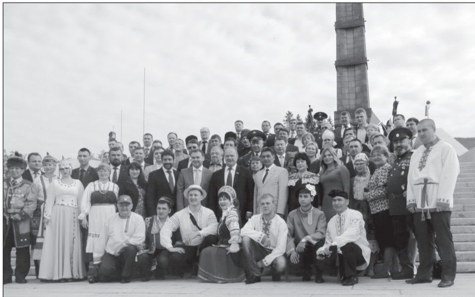
● У монумента Дружбы народов.

Председатель ЦК КПРФ, руководитель фракции КПРФ в Государственной Думе Федерального Собрания Российской Федерации Геннадий Андреевич Зюганов . На форуме присутствовали известные деятели науки, образования, здравоохранения, культуры и искусства, депутаты Государственной Думы ФС РФ и Законодательных Собраний субъектов Российской Федерации, представители творческих и профессиональных союзов, патристических, национальных, спортивных, религиозных объединений, средств массовой информации.