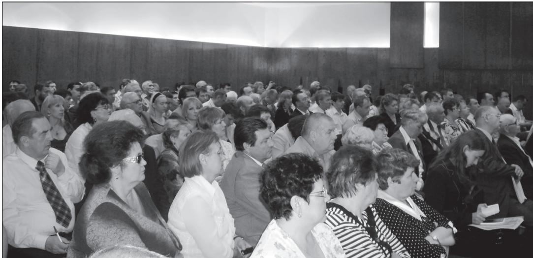
В зале Мемориального Ленинского комплекса.

Накануне открытия семинара делегация ЦК КПРФ во главе с И.И. Мельниковым встретилась с руководством ЗАО «Авиастар» – одним из флагманов отечественного самолётостроения, переживающим ныне тяжёлые времена. Были обсуждены меры, которые необходимо предпринять думской фракции КПРФ для защиты авиапрома России. Представители трудового коллектива предприятия передали депутатам-коммунистам просьбы и предложения для рассмотрения их фракцией КПРФ.