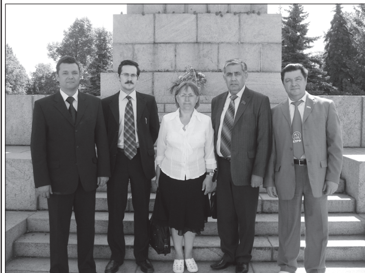
Чувашская делегация в Ульяновске.