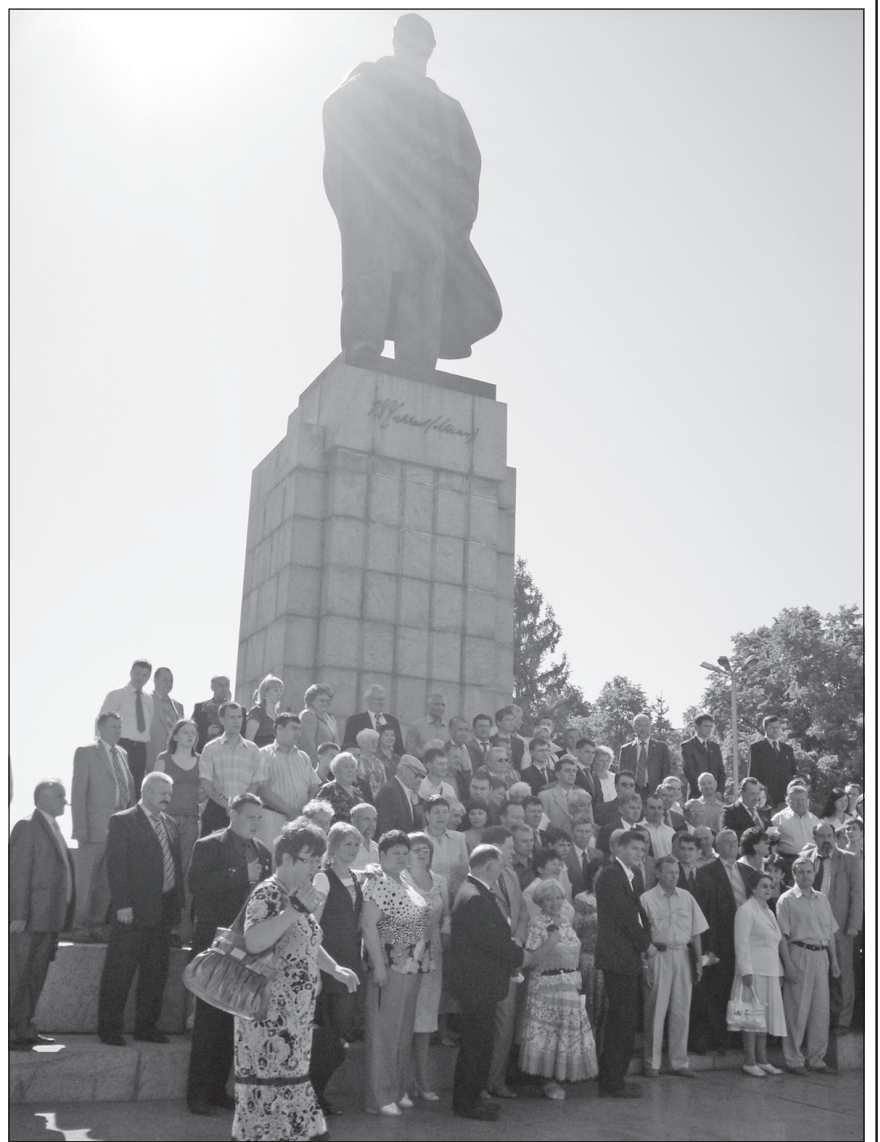
Участники семинара на площади 100-летия со дня рождения В.И. Ленина.

Участники семинара поддержали прозвучавшее предложение о принятии ЦК мер по финансовой поддержке районных и город-