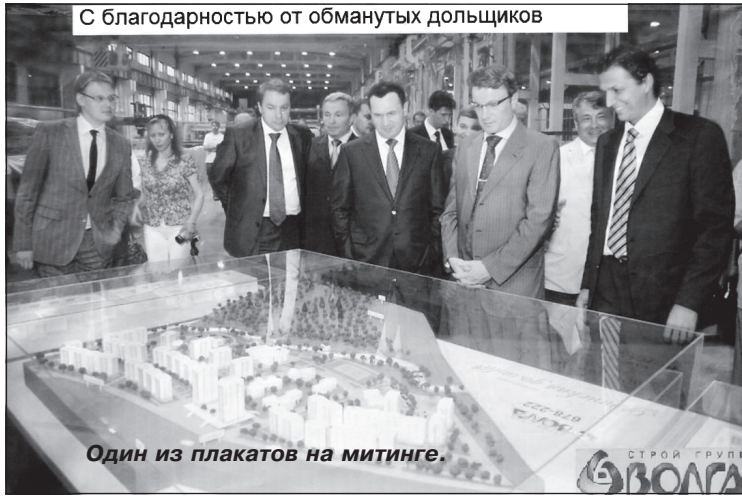
Один из плакатов на митинге.