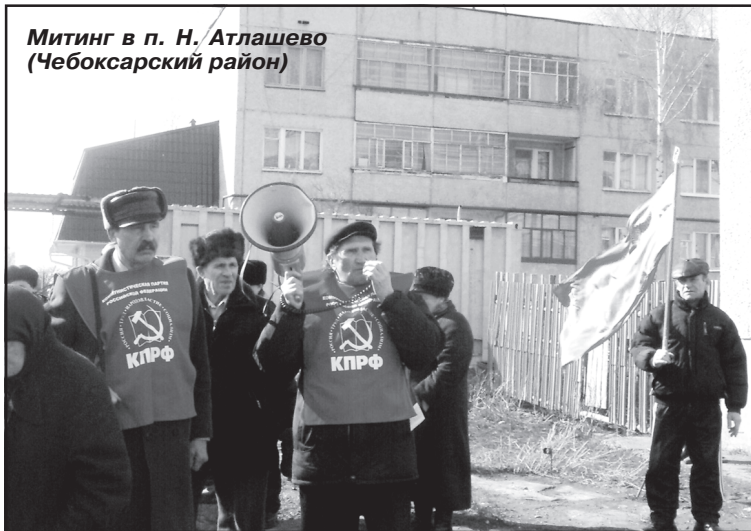
Митинг в п. Н. Атлашево (Чебоксарский район)

В Чувашской Республике прошли митинги и пикеты в рамках Всероссийской акции протеста против бездарной политики правительства по выводу страны из кризиса.