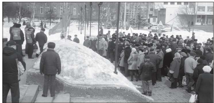
Митинг в Новочебоксарске.