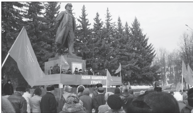
Митинг в Чебоксарах.