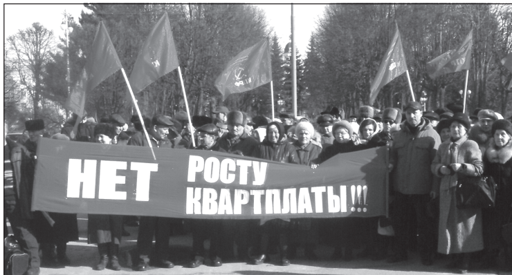
Участники пикета у Дома правительства.

Пикет протеста под лозунгом «Нет — росту квартплаты!», организованный Чебоксарским горкомом КПРФ, состоялся 19 марта у Дома правительства Чувашии. Он был приурочен к заседанию Совета по стратегическому развитию. В акции приняли участие более 200 человек.