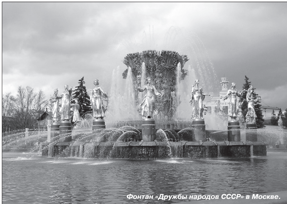
Фонтан «Дружбы народов СССР» в Москве.

– Спасибо всем – за тёплые поздравления, за красивые цветы, за дорогие подарки! – благодарит юбиляр в конце вечера. – Сегодня мне показалось, что снова возродился Советский Союз. Может быть, он когда-нибудь, пусть уже в другом составе, и в самом деле воссоздастся, а?!