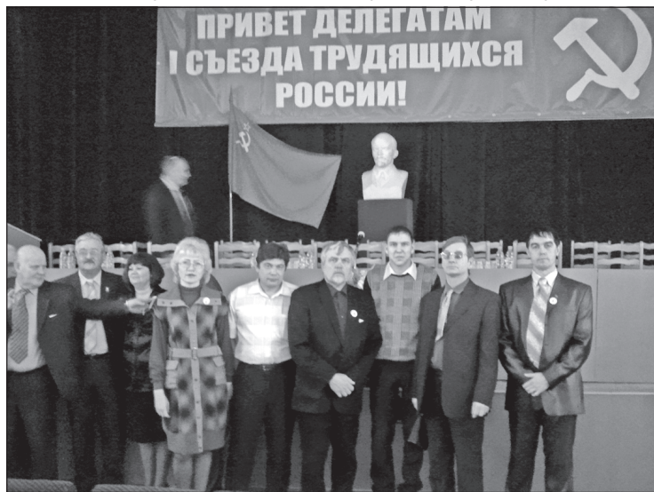
Чувашские делегаты на съезде.

Страницу подготовил редактор сайта Дмитрий ЕВСЕЕВ