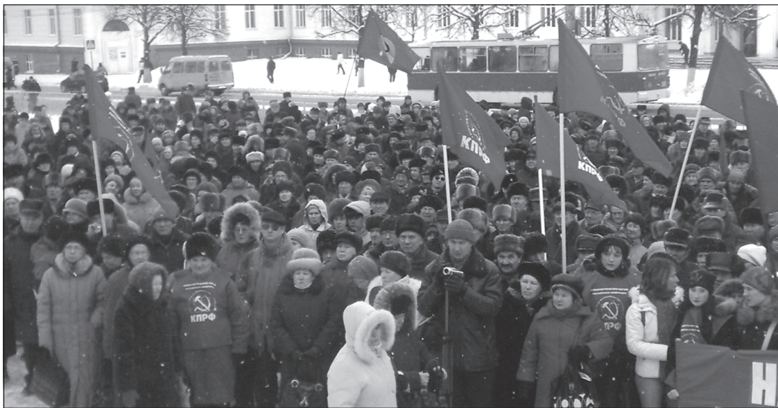
Митинг в Чебоксарах.

сектора Чувашии. По его предложению митинг одобрил создание