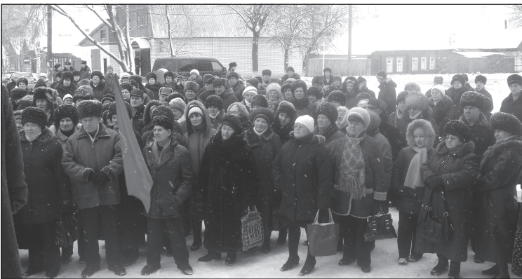
Митинг в Алатыре.