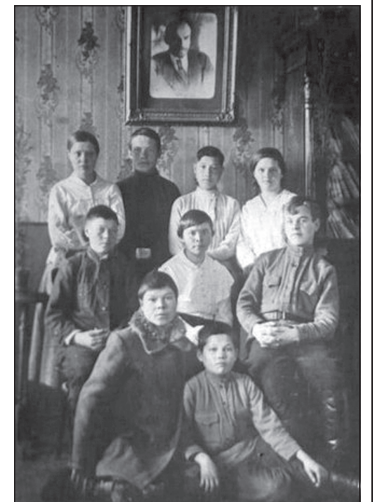
Участники I Общечувашского съезда учащихся в г. Казань. 10-17 мая 1918 г.

В момент формирования молодёжной организации ещё не был налажен учёт численности комсомольцев. Во время переписи в 1921 г. учтено 903 чел., в 1926 г. численность со-