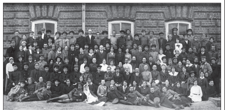
Члены Ядринского укома РКСМ первого созыва. 1920 г.

По материалам электронного издания Госархива современной истории ЧР «Родная моя, дорогая страна, ты можешь на нас положиться!»