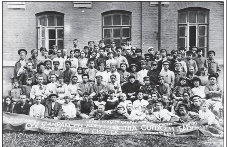
Делегаты I Всероссийского съезда чувашских секций, ячеек и активных работников РКСМ в г. Казань. Июнь 1920 г.

16-20 июня 1920 г. в Казани состоялся I Всероссийский съезд чувашских секций и работников РКСМ среди чувашской молодёжи, на котором было создано Центральное бюро чувашских секций при ЦК РКСМ. 24 июня 1920 г. ВЦИК принял декрет об образовании Чувашской автономной области. Решением ЦК РКСМ от 10 августа 1920 г. был утверждён временный Чувашский областной комитет РКСМ с местонахождением в г. Чебоксары, который приступил к работе 13 августа 1920 г. В последующем созданы: Чебоксарская городская организация, Ибресинская (Батыревская) уездная организация. В 1925 г. с присоединением к Чувашской АССР части Алатырской уездной областной организации пополнилось одноимённым укомом РЛКСМ.