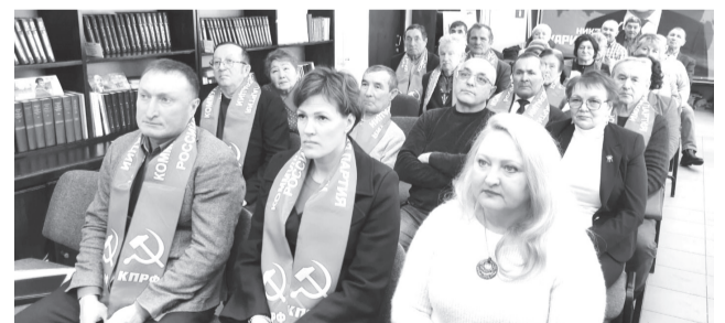
• Коммунисты Чувашии на собрании.

Геннадий Андреевич заявил, что недостаточно просто обозначить проблему. «За этим должна следовать чёткая и ясная программа, каким образом будем её решать», — сказал он и подчеркнул, что про-