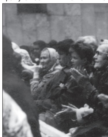
Гости праздника. 1994 г.