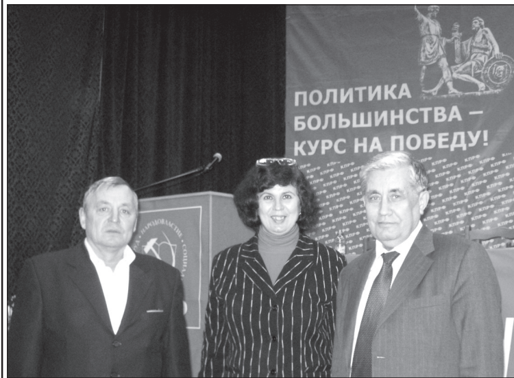
Делегаты съезда от Чувашской партийной организации.

Пением «Интернационала» XIV съезд Коммунистической партии Российской Федерации закончил свою работу.