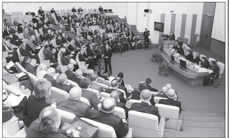
(Окончание. Начало на 2-й стр.)

Это при том, что уже в 2008 году разрыв между регионами по уровню абсолютной бедности был семикратным, а в 2010 году он ещё увеличился.