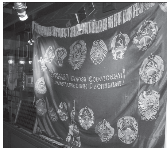
Белорусы уважают своё советское прошлое. Стенд в одном из минских кафе.

Кстати, о языках. Республика Беларусь – многонациональное государство. Помимо белорусов и русских, там живёт немало украинцев, поляков, литовцев, евреев, татар. Есть и чуваша (работают две национально-культурные автономии белорусских чувашей – «Атал» и «Шупашкар»). Попытки сравнить между собой разные национальности, предпринимавшиеся правившими в начале 90-х либерал-националистами, встретили решительный отпор белорусского общества, воспитанного в лучших традициях дружбы советских народов. В Беларуси мирно соседствуют народы и религии. Сегодня в стране два равноправных государственных языка – белорусский и русский. Однако в го-