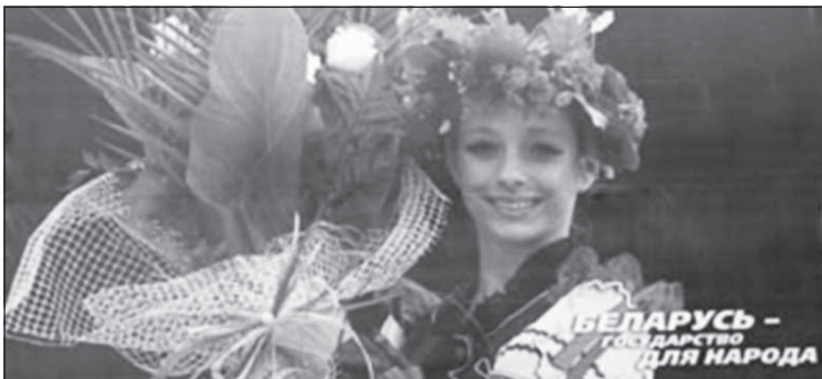
Баннер на улицах Минска.