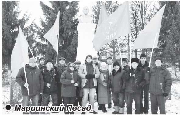
● Мариинский Посад.