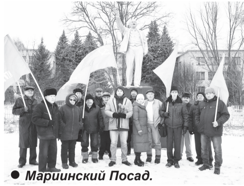
● Мариинский Посад.