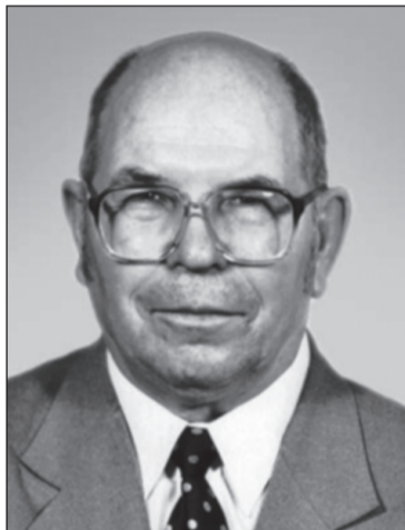
сора, заведующего кафедрой русского языка ЧГПУ им. И.Я. Яковлева, действительного

На этот вопрос мы попросили ответить замечательного учёного, чьи воспитанники работают во всех школах и многих вузах нашей республики, доктора педагогических наук, профес-