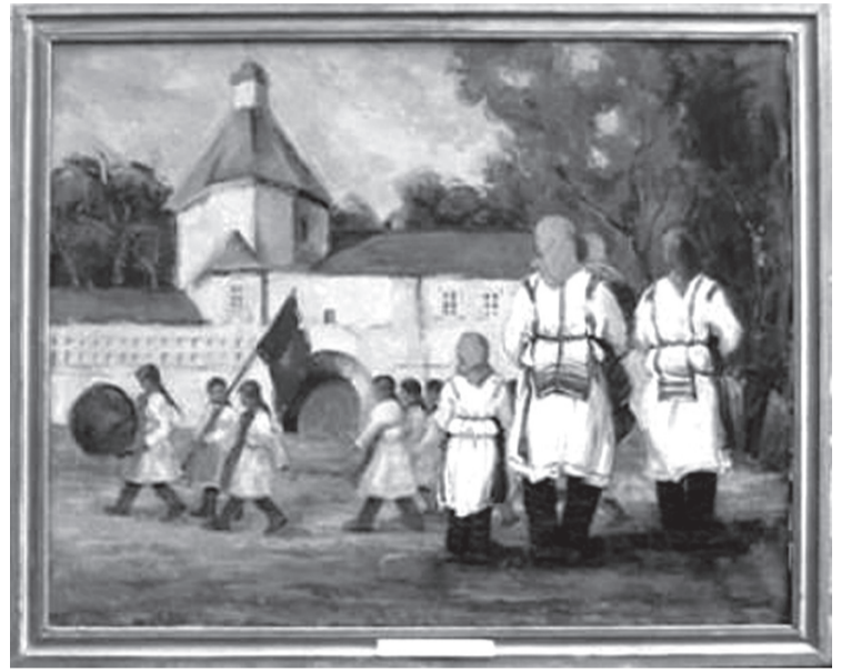
С картины Ф. Богородского «Чувашские пионеры». ЧГХМ.

Пионерская организация была незаменима в воспита-