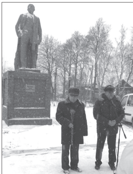
Лидер коммунистов Татарстана и глава Тетюшского района на открытии памятника.

Минувшей весной в результате паводка талые воды попали под фундамент памятника, фундамент просел. Коммунисты районного отделения КПРФ, среди которых немало чувашей, обратились к руководству города и района с прось-