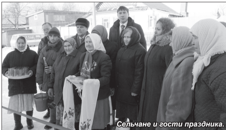
Сельчане и гости праздника.