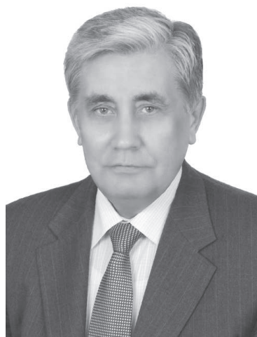
Депутат Государственной Думы РФ шестого созыва В.С. Шурчанов.

На выборах в Госсовет ЧР поддержка КПРФ также выросла. Однако численность нашей фракции, к сожалению, при этом сократилась на одного депутата – таковы хитрости избирательной системы в Чувашии.