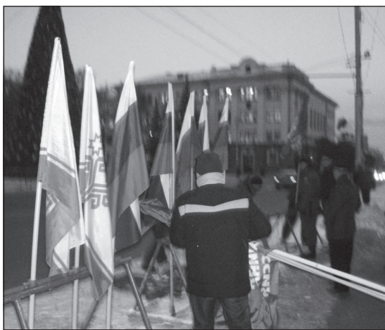
Коммунисты снимают флаги «ЕР» для передачи их в полицию.

Чувашский реском КПРФ просит собственников флагов с символикой «Единой России», установленных 2 декабря 2011 года неподалёку от главного входа в здание Сельхозакадемии, обратиться за помощью в УВД по г. Чебоксары.