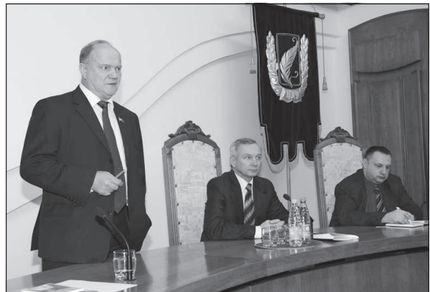
Г.А. Зюганов выступает в Белорусском госуниверситете.

тить перспективы на будущее. Фактически – это форма прямой народной демократии, которой так не хватает в нынешней России.