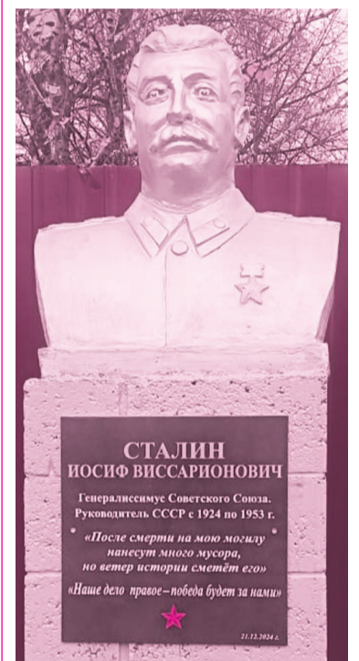
В деревне Хорабыр Краснотайского муниципального округа 7 ноября 2024 года в 13 часов состоится открытие памятника Иосифу Виссарионовичу Сталину. Приглашаются все желающие.

Геннадий Зюганов: – В выборе между Д. Трампом и К. Харрис нет прогрессивных кандидатов. В схватке сошлись две группы империалистов из США. Как известно, хрен редьки не слаще.