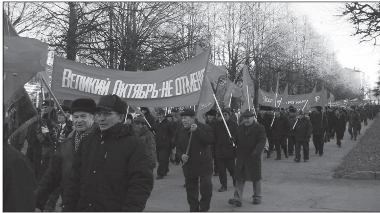
Демонстрация в Чебоксарах.