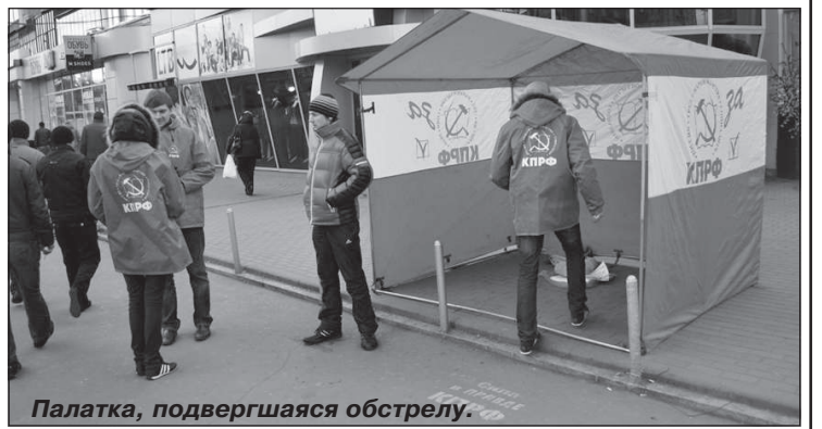
Палатка, подвергшаяся обстрелу.