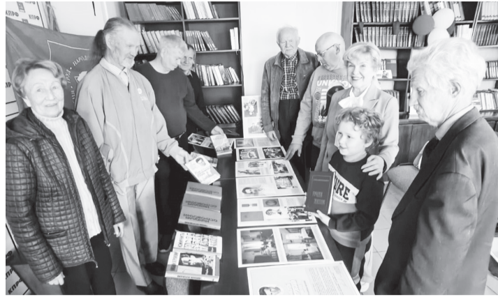
В Чебоксарах возобновил свою работу политклуб «Возрождение» при Чувашском рескоме КПРФ. На прошедшем занятии обсуждались три актуальные темы.