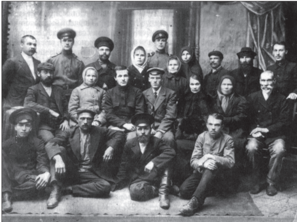
Члены Чебоксарского Совета рабочих и солдатских депутатов. 1917 г.

Большую работу проделали Советы и по реализации ленинского Декрета о земле.