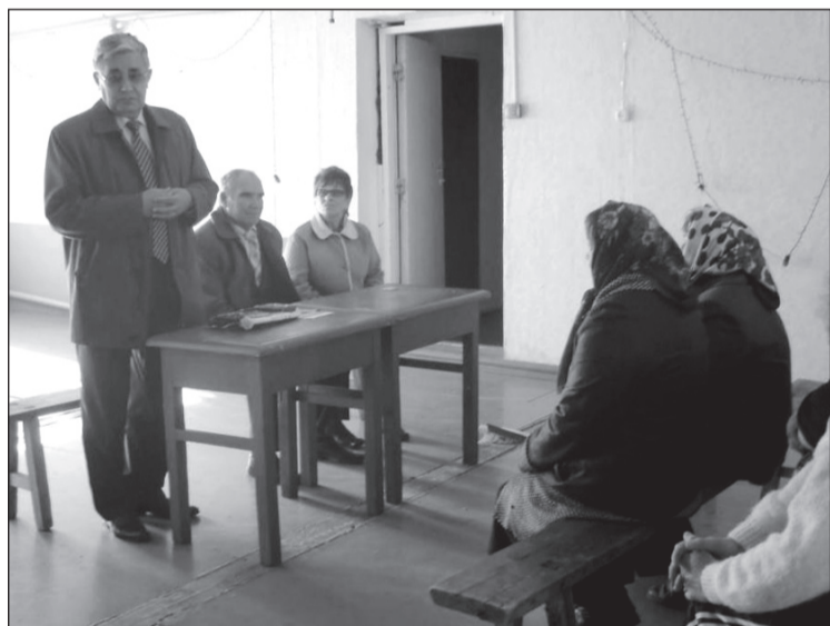
Встреча с сельскими избирателями Пензенской области.