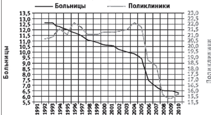
Число больниц и поликлиник в РФ, тыс.

В рейтинге по состоянию здоровья населения 145 стран, где проживают более 1 млн. человек, составленном агентством Bloomberg, Россия заняла 97-е место, по соседству с Восточным Тимором, Мадагаскаром, Ираком и Бангладеш. В рейтинге ВОЗ по расходам на здравоохранение Россия вообще занимает лишь 115-е место.