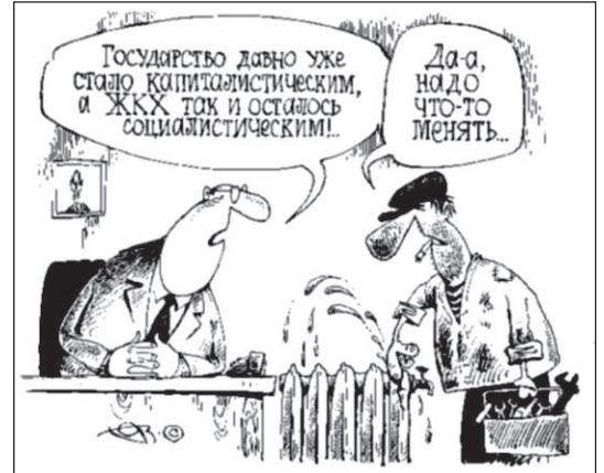
чества услуг, то власть добилась своего! Жильцы дома.

За что же мы платим управляющей компании деньги? Если суть всей реформы ЖКХ сводилась лишь к резкому росту тарифов при резком падении ка-