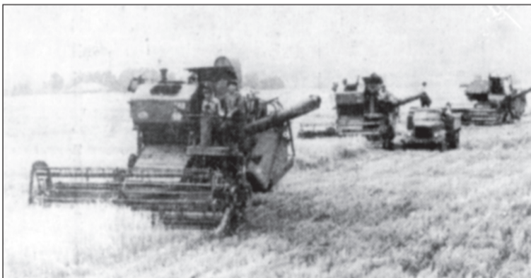
Уборка урожая на полях Чебоксарского района. 70-е годы.

Семимильными шагами шло в это время и промышленное развитие Чебоксарского района. Были построены: Альгешевская