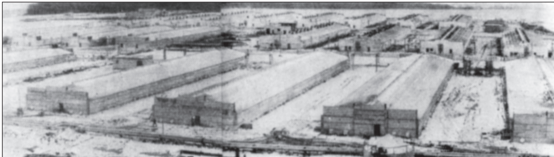
Строительство птицефабрики «Кугесинская». 80-е годы.

Настоящий экономический прорыв в Чебоксарском районе начался с 1929 – 1931 гг., после объединения крестьян в коллективные хозяйства. Не всё шло гладко в ходе коллективизации, было немало фактов необоснованного раскулачивания и высылки из республики крепких крестьян. Однако именно эти созданные коллективные хозяйства стали основой для значительного роста сельскохозяйственного производства в нашем районе,