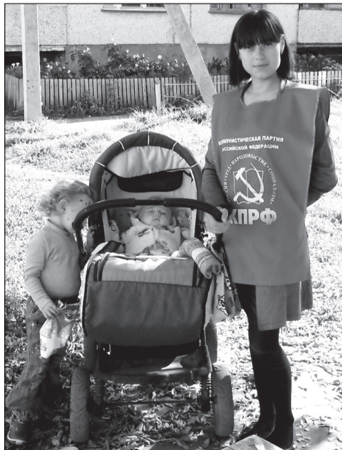
На пикете в Новом Атлашеве (Чебоксарский район) заявление о приёме в КПРФ написала молодая мама.