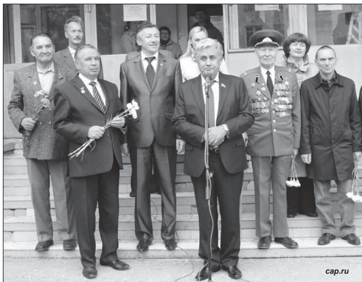
Выступление на линейке в Чебоксарском педколледже.