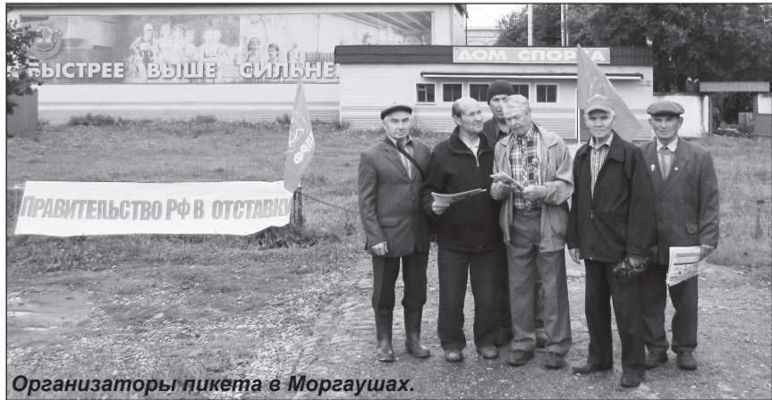
Организаторы пикета в Моргаушах.