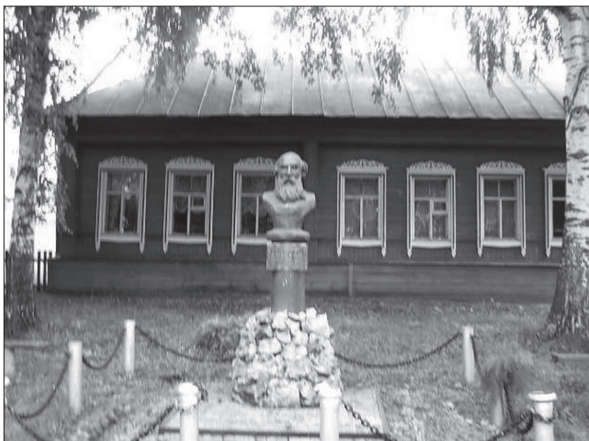
Мемориальный музей А.Н. Крылова в Порецком районе.