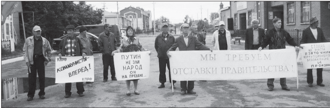
(Окончание. Начало на 1-й стр.)