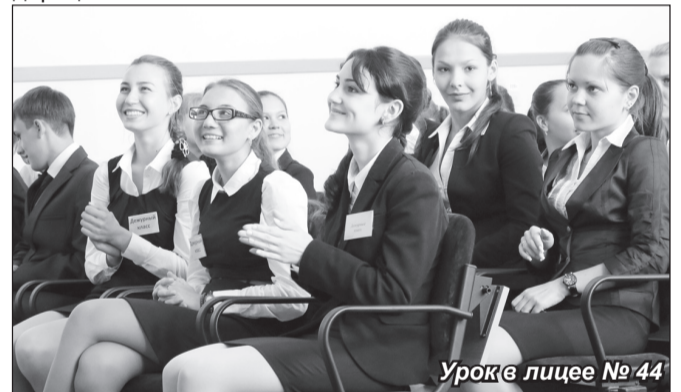
Урок в лицее № 44

Занятия были посвящены наступающему 12 декабря текущего года двадцатилетнему юбилею Конституции Российской Федерации.