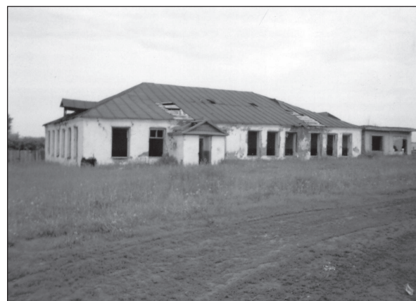
Заброшенное здание бывшей школы.

Почти десять лет назад закрыли основную общеобразовательную школу в Первых Синьялах (Марпосадский район).