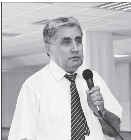
Секретарь ЦК КПРФ, депутат Государственной Думы РФ В.С.