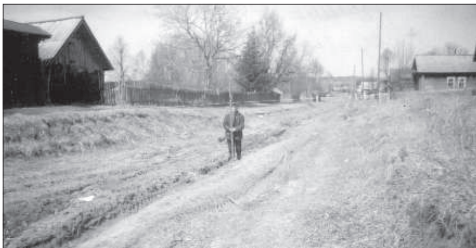
Автор статьи измеряет глубину проседания дороги.

Через год мы будем праздновать полувековой юбилей первого космического полёта нашего великого земляка Андрияна Григорьевича Николаева. Этот полёт прославил не только его имя, но и народ, к которому принадлежал Андриян Григорьевич. О