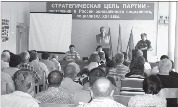
6 августа в зале Чебоксарского горкома КПРФ состоялся семинар-совещание республиканского

отделения партии, посвященный вопросам предстоящих выборов в Государственную думу России и Государственный Совет Чувашской Республики.