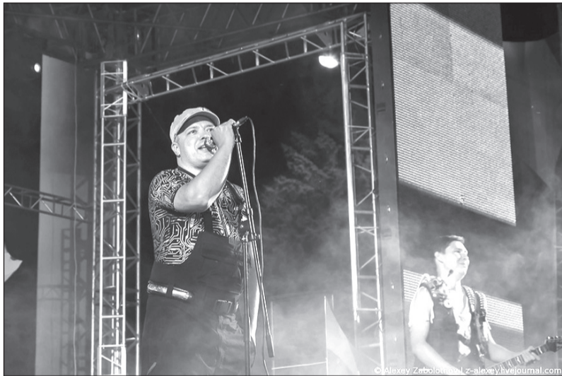
Та самая песня про «падлу»