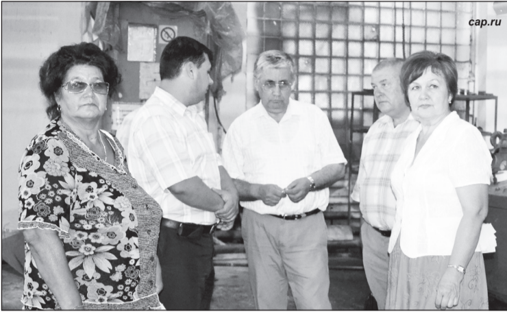
В.С. Шурчанов с сопровождающими лицами в цехе бумажной фабрики.

Алатырь в ходе рабочей поездки 15 августа посетил депутат Государственной Думы Российской Федерации, первый секретарь Чувашского республиканского комитета КПРФ Валентин Сергеевич Шурчанов.