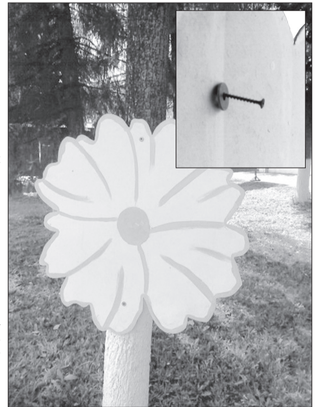
Цветочки на шурупах