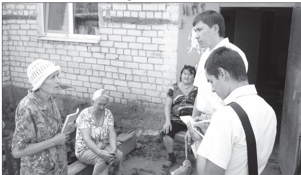
Шихазаны. Разговор с жильцами дома по ул. 40 лет Победы.

Сотрудницы почтового отделения, занятые работой, поначалу были немногословны. Но в ходе разговора, увидев нашу заинтересованность, поделились своими заботами. Объём работы колоссальный. Дел много, персонала не хватает. Зарплата минимальная, начальство безразлично