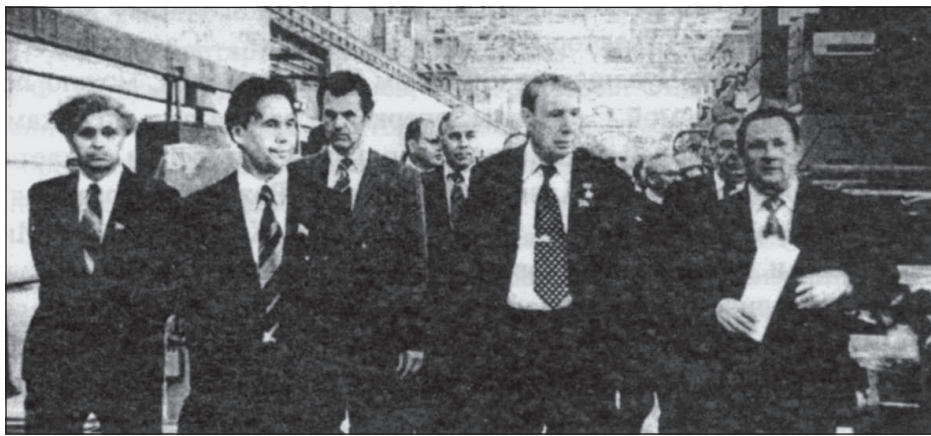
И.П. Прокопьев и заместитель Председателя Совмина СССР В.Н. Новиков на строительстве ЧЗПТ.