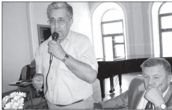
дидатуру лидера партии Г.А. Зюганова на пост президента Российской Федерации.

Коммунисты Татарстана единогласно поддержали предложение руководства ТРО КПРФ выдвинуть кан-