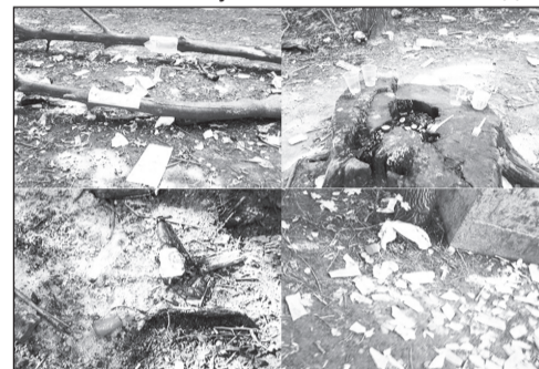
Картинки из чебоксарских парков.

Знакомство с экологией Лакреевского леса порадовало нас несколько больше. Территория непосредственного отдыха горожан и гостей столицы вполне ухожена. Но стоит отойти чуть в сторону и зайти вглубь леса, как взору предстали те же самые места посиделок выпивох, где полно бутылок, полиэтиленовых пакетов и других отходов, разложение которых в природных условиях займёт не одно