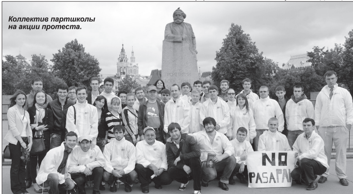
Коллектив партшколы на акции протеста.