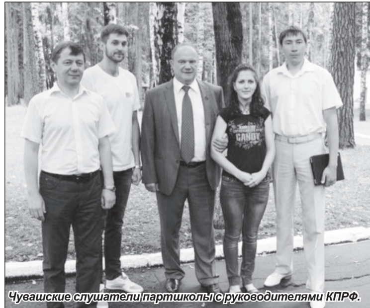
Чувашские слушатели партшколы с руководителями КПРФ.