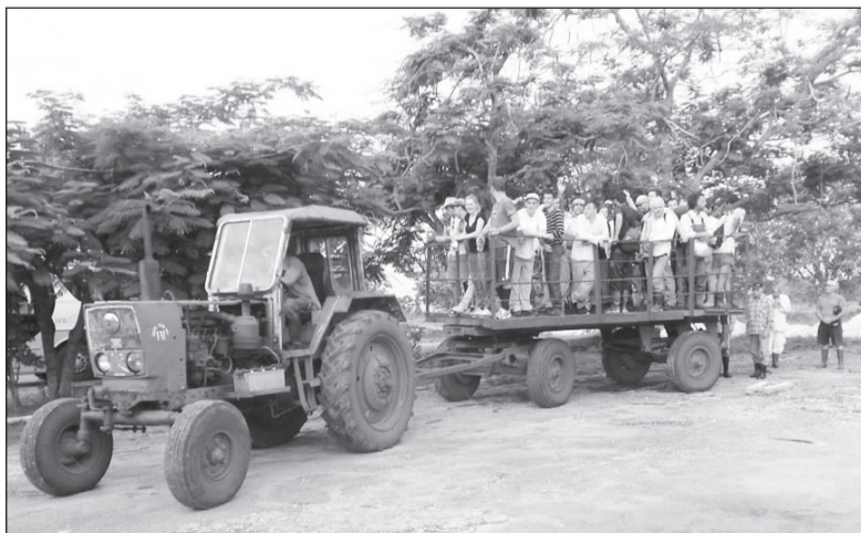
Выезд международной бригады на работу.