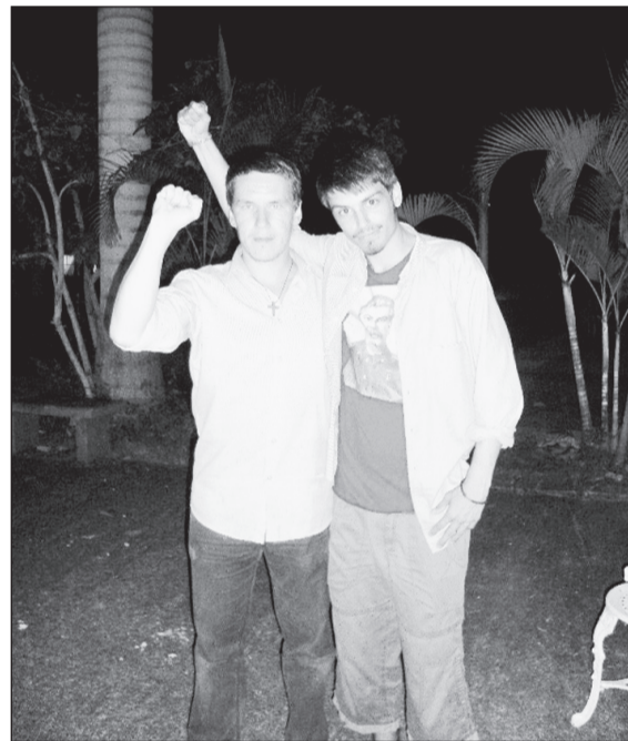
Автор статьи (слева) с кубинским товарищем.

К сожалению, среди делегатов из России кроме меня коммунистов не было. Пребыванием в Лагере «отметилась» лишь группа студентов МГУ из так называемых «строительных отрядов». Но лучше бы их там не было! Вели они себя как истинные «молодо-наглецы» и запомнились лишь пьянством, матерщиной, прогулами работы и даже воровством