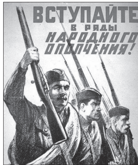
Народное ополчение КПРФ...

Кто идёт в «народный» фронт? – Труссы, прихлебальи. Кто идёт в «народный» фронт? – Кто нагрёб немало. Кто идёт в «народный» фронт? – Лузер и предатель. Кто идёт в «народный» фронт? – Клязунник-старатель. И певцы, и смехачи Иль образованцы, Лихачи и стукачи – Всякие засланцы. Собирает «Едро-мать»,