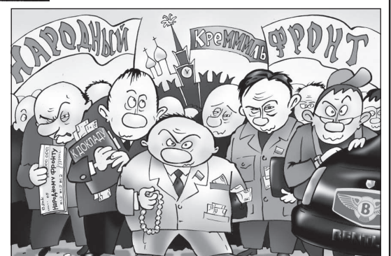
... против путинского «народного» фронта.