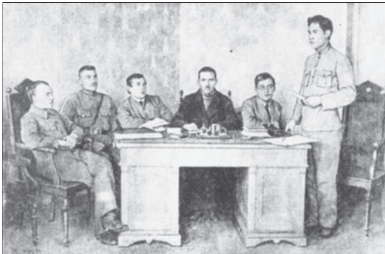
Члены первого правительства Чувашии – Временного ревкома ЧАО. 1920 г.

В последующие годы были расширены существующие промышленные предприятия и в годы первых пятилеток (народное хозяйство Чувашии также развивалось по пятилетним планам) были построены предприятия химической, лесоперерабатывающей, пищевой промышленности, строительных материалов, машиностроения, организованы коллективные хозяйства на селе, по-