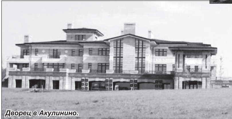
Дворец в Акулинино.

Вроде Метрострой за 150 миллионов там копал пруды. Маленький дом – это сына, гостевой, а основной – это его. Там есть молельня, часовня. Плиткой там золотой отделано, а помещение очень большое – хамам (турецкая баня, – ред.), баня, парная, панорама, чтобы на лес смотреть», — сказал он.