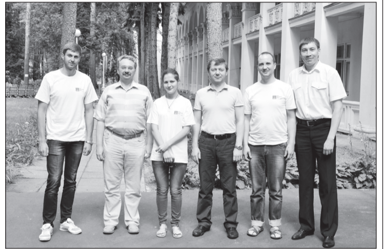
Представители Чувашии с руководством партшколы.