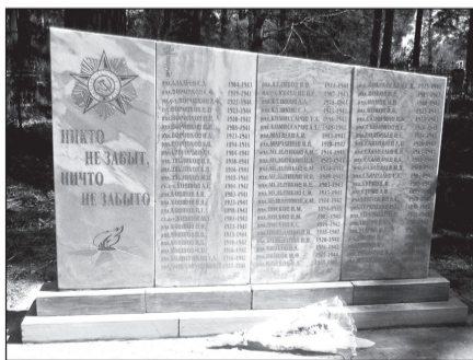
Обелиск в с. Корзино.