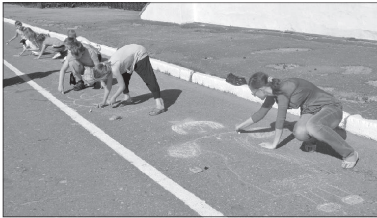
Конкурс детских рисунков в Шумерле.

В Канаше в раздаче газет и листовок на улицах и на городском рынке приняли участие не только коммунисты и комсомольцы города, но и школьники, которые совсем недавно, 19 мая, стали пионерами. Растим достойную смену!