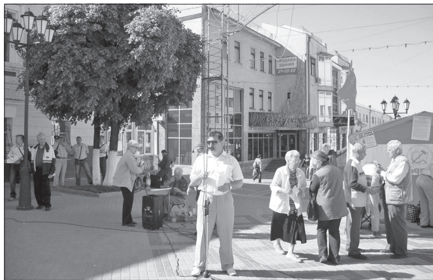
Митинг в Чебоксарах.