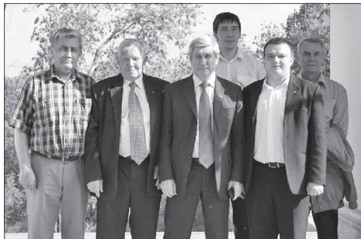
Заместитель Председателя ЦК КПРФ И.И. Мельников с представителями чувашской партийной делегации.

делены задачи на ближайший период, рассмотрены вопросы подготовки к двум федеральным избирательным кампаниям, состоялся обмен опытом организационной, агитационно-пропагандистской, массовой работы региональных партийных отделений.