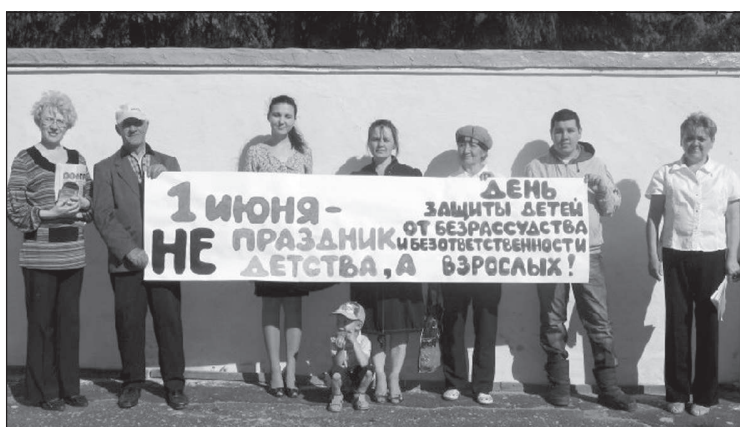
Участники пикета в Шумерле.

В столице Чувашии митинг в защиту материнства и детства состоялся на бульваре купца Ефре-