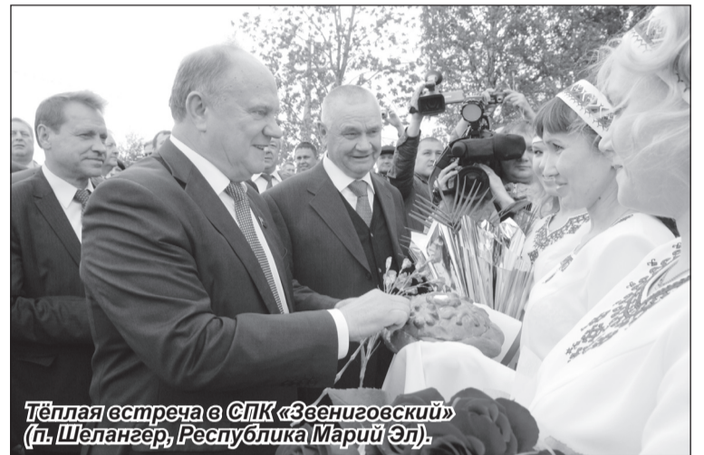
Тёплая встреча в СПК «Звениговский» (п. Шелангер, Республика Марий Эл).

Г.А. Зюганов напомнил, что несколько лет назад СПК «Звениговский» подвергся рейдерской атаке. И лишь коммунисты пришли на помощь его трудо-