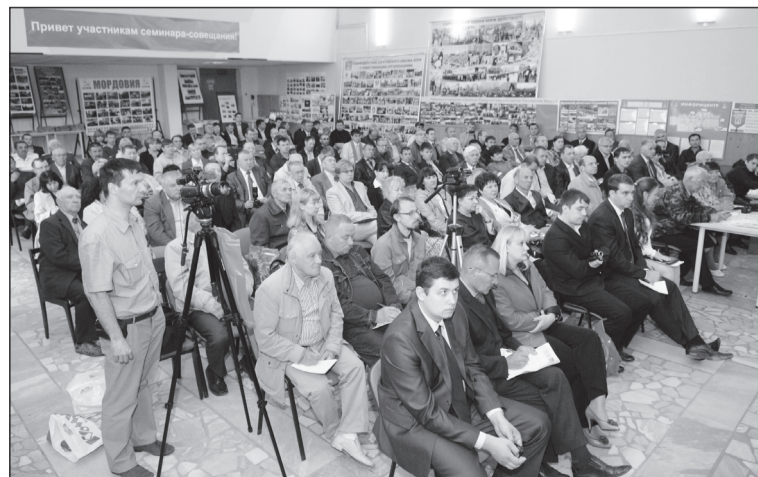
Привет участникам семинара-совещания