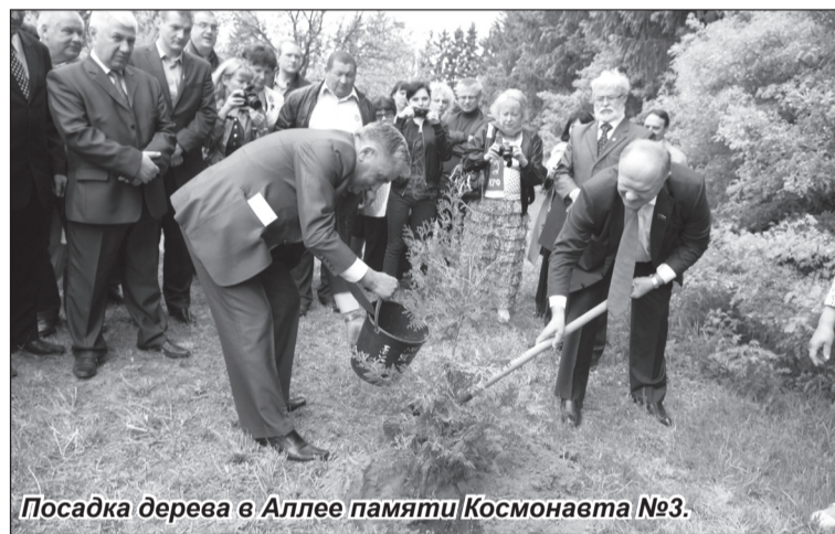
Посадка дерева в Аллее памяти Космонавта №3.

евич призвал партийный актив усилить борьбу против ликвидаторов и разрушителей российского государства на примере конкретных лиц из правящей