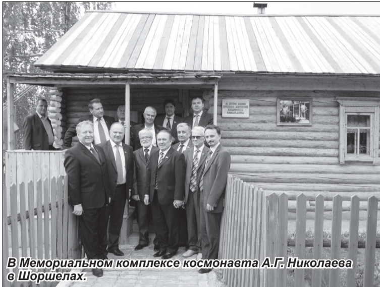
В Мемориальном комплексе космонавта А.Г. Николаева в Шоршелах.