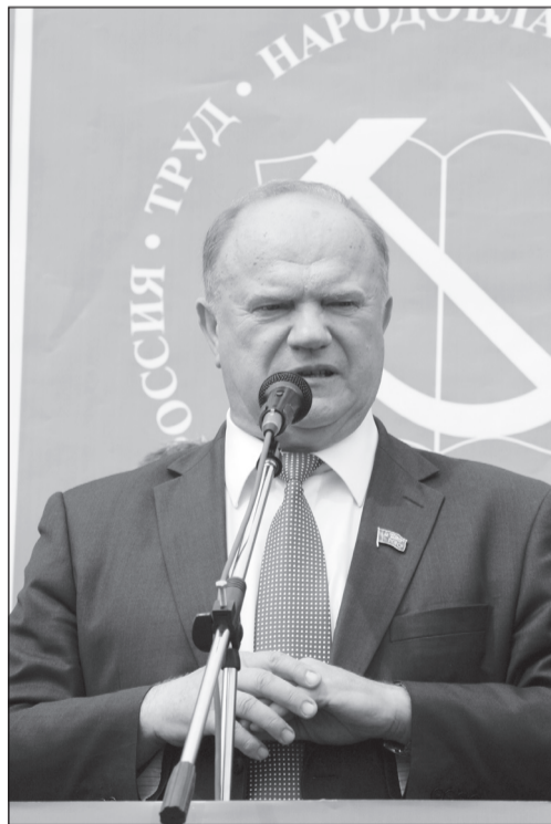
Выступление на митинге в г. Чебоксары.