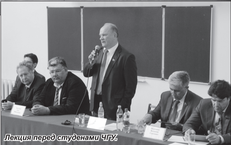
Лекция перед студентами ЧГУ.