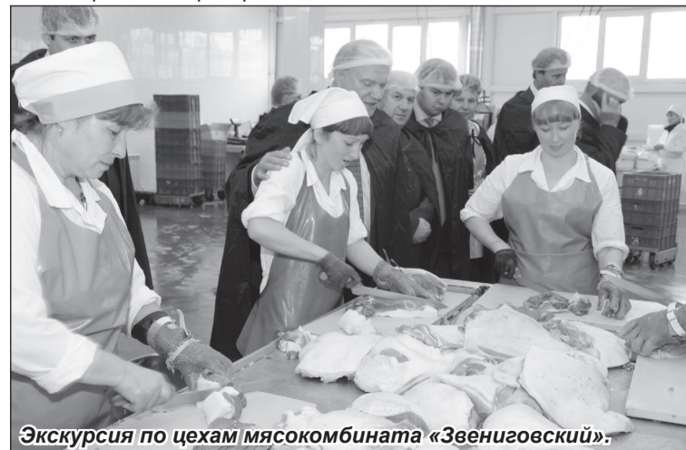
Экскурсия по цехам мясокомбината «Звениговский».