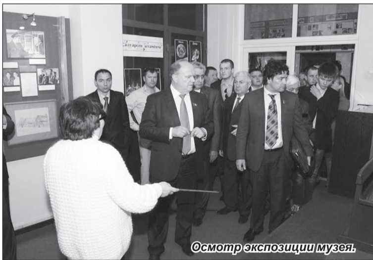
Обзор экспозиции музея.

Геннадий Андреевич напомнил, что за проведение референдума по национализации коммунистами собрано 12 миллионов подписей. «Народный референдум – это вопрос выживания страны», – сказал Председатель ЦК КПРФ.