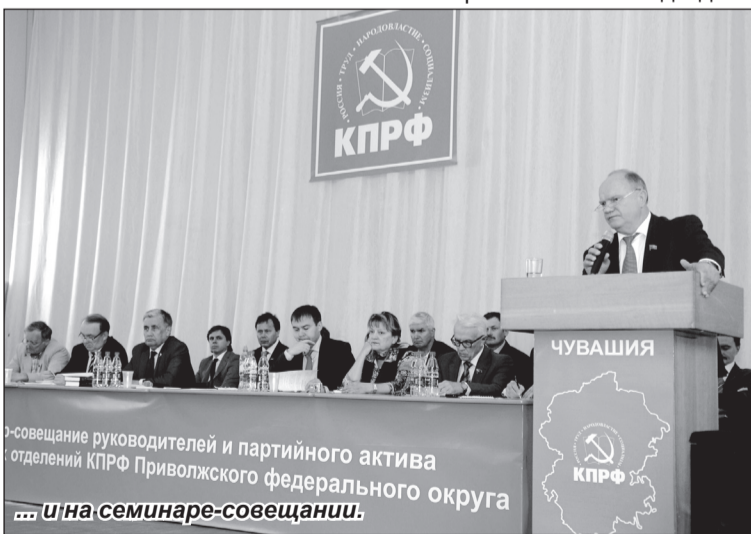
...и на семинаре-совещании.

Днём, 24 мая, в ФОЦ «Белые камни» (Маринско-Посадский район) открылся семинар-совещание партийного актива Приволжского Федерального округа. В нём приняли участие представители 14 регионов. Перед участниками форума высту-