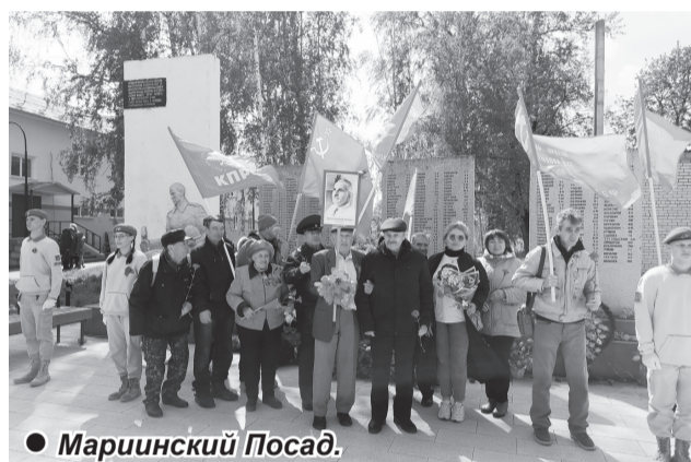
● Мариинский Посад.