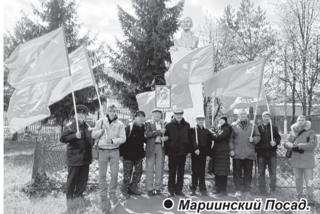
● Мариинский Посад.