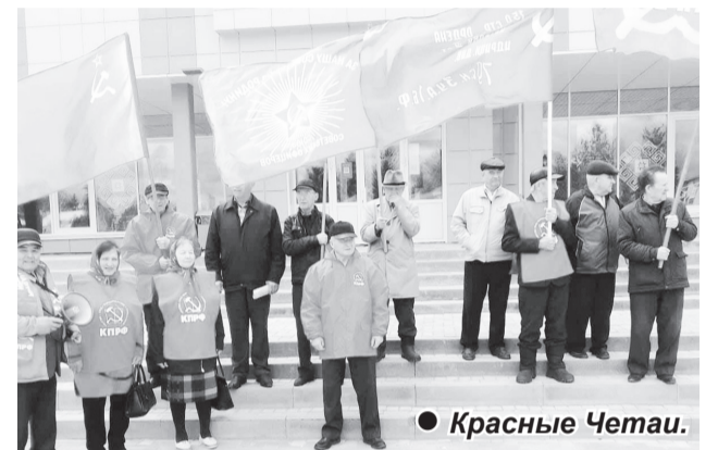
● Красные Четаи.