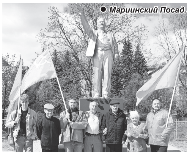
● Мариинский Посад.