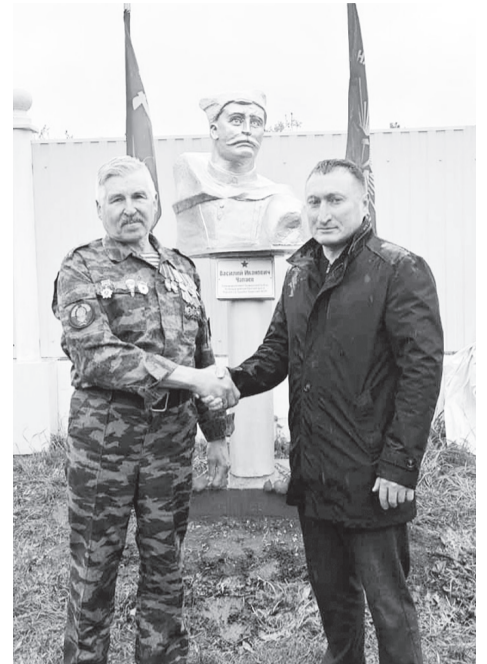
Советского Союза Г.К. Жукова. Завершилось мероприятие возложением цветов к открытому бюсту и общим фотографированием.