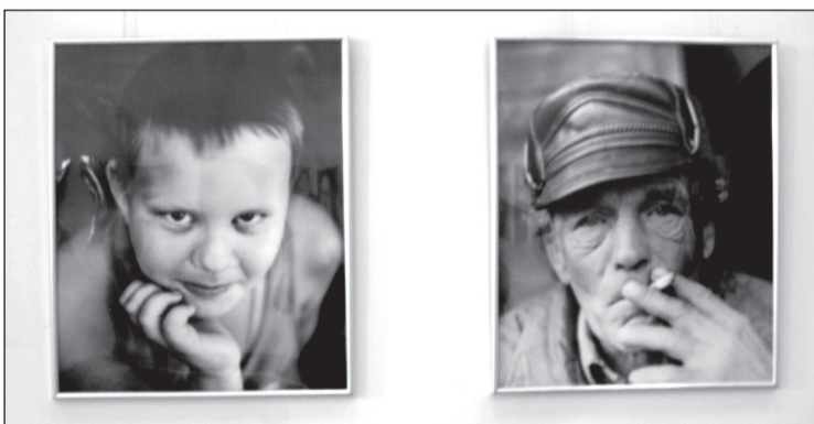
Фотографии с выставки.