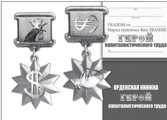
Конкурс на лучший эскиз медали «Герой капиталистического труда»