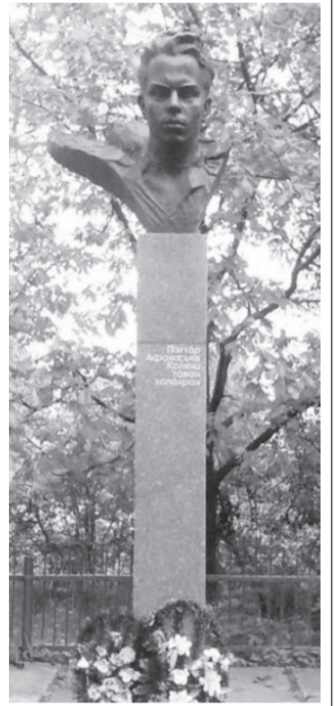
Обелиск героя в родном селе.

Много времени прошло уже с тех пор. Но до сих пор чтят на малой родине героя его память. 29 января 2013 года в Кармалах в честь 70-летия подвига Николая Афанасьева у его памятника состоялся торжественный митинг, где присутствовали его