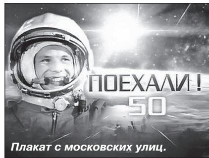
Плакат с московских улиц.

Отсутствие надписи «СССР» на шлеме Юрия Гагарина в рекламе фильмов о космонавтике, на растяжках и плакатах – не случайность, а целенаправленные действия по стиранию СССР из памяти» – резюмируют блогеры, которые напоминают, что за полётом Гагарина стоял трудовой подвиг целой страны – Советского Союза.