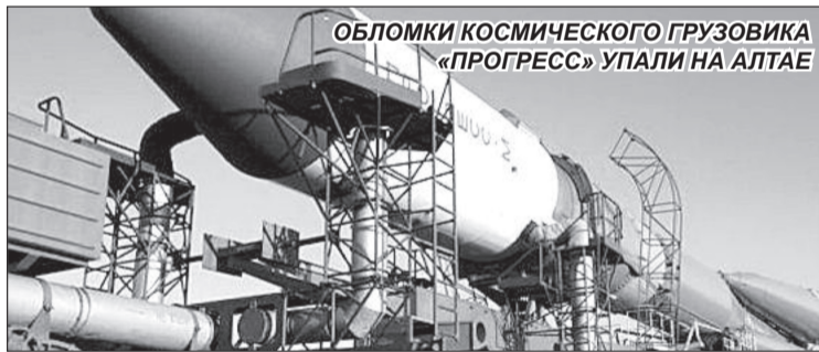
ОБЛОМКИ КОСМИЧЕСКОГО ГРУЗОВИКА «ПРОГРЕСС» УПАЛИ НА АЛТАЕ

Двадцать постсоветских лет ознаменовались стремительной деградацией российской космической отрасли. «Роскосмос» может похвастать лишь затопленной в Тихом океане орбитальной станцией «Мир», представляющей собой сложный многоцелевой научно-исследовательский комплекс, да десятками потерянных спутников. Даже 50-летие полета Юрия Гагарина «Роскосмос» отпраздновал серией проваль-