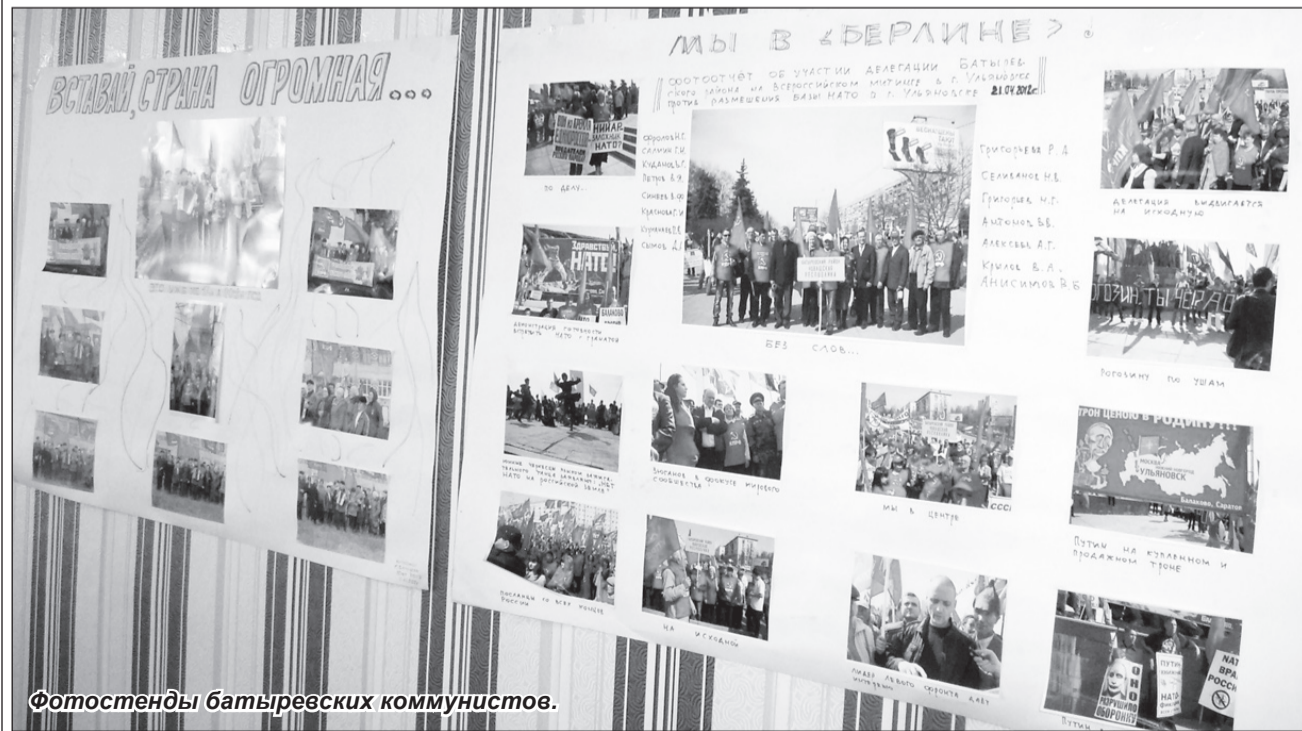
Фотостенды батыревских коммунистов.

Если говорить о проблемах, то перед нами по-прежнему стоит задача охватить сеть первичных организа-