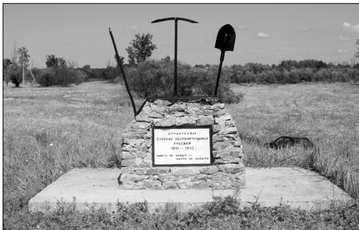
Обелиск в честь строителей Сурского оборонительного рубежа.

Случались моменты паники в то критическое время и среди отдельных военных. Например, в один из октябрьских дней 1941 года была попытка самовольно разгрузить на станции Шумерля товарный состав с боеприпасами, предназначенными