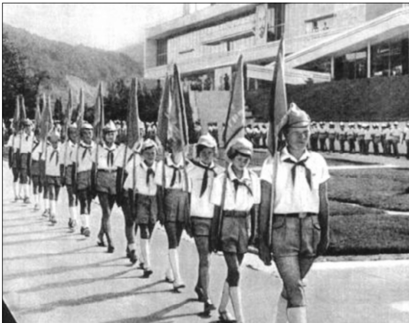
Чувашские пионеры в Артеке. 80-е годы прошлого века.

Ввиду отсутствия фабрично-заводских коллективов