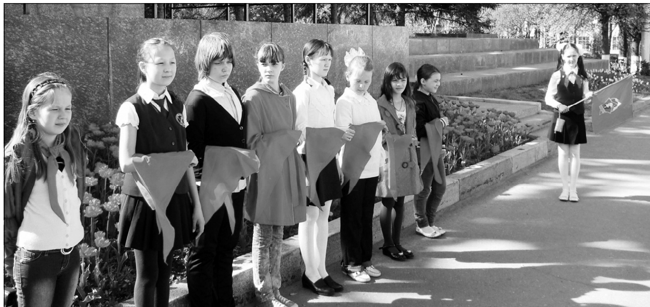
Приём в пионеры чебоксарских школьников. 2011 год.