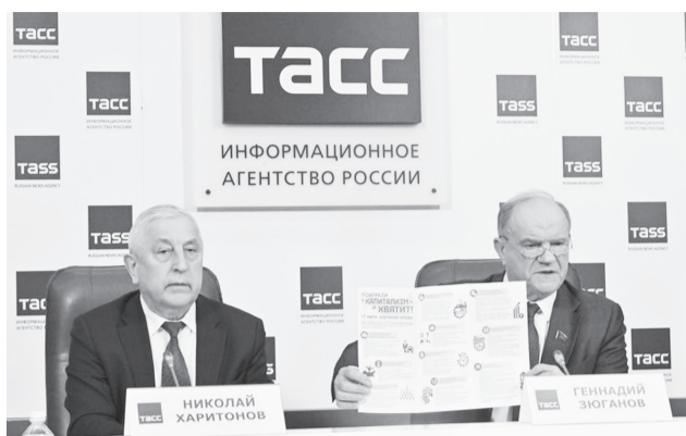
НИКОЛАЙ ХАРИТОНОВ ГЕННАДИЙ ЗЮГАНОВ

Президент сам на встрече на Валдае перед журналистами прямо заявил, что капитализм за-