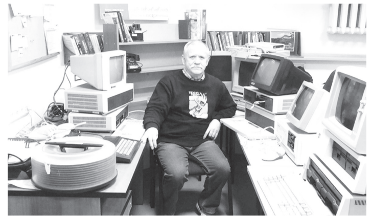
В планах музея – проект о замечательных земляках чувашского края.

Посетители музея оставляют в книге отзывов благодарственные записи.