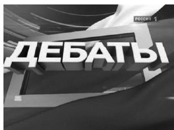
График дебатов на республиканских каналах

Теледебаты ГТРК «Чувашия» на канале «Россия-24» 29 февраля, 2 марта с 9.00 до 10.00