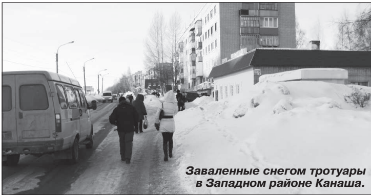
Заваленные снегом тротуары в Западном районе Канаша.

Уважаемая редакция! Обращается к Вам житель Канаша. Прочитал в «Чебоксарской правде» (№ 3 с.г.) статью «Канашцы утопают в снегу: ответственных нет?» и подтверждаю всё изложенное в ней автором А. Лаптевым. Эти факты вынуждена признать и администрация, объявившая работу ООО «Стройсервис» по содержанию дорог в зимних условиях неудовлетворительной. Но снежные завалы – это только полбеды. Есть в нашем городском хозяйстве ещё одна серьёзная проблема.