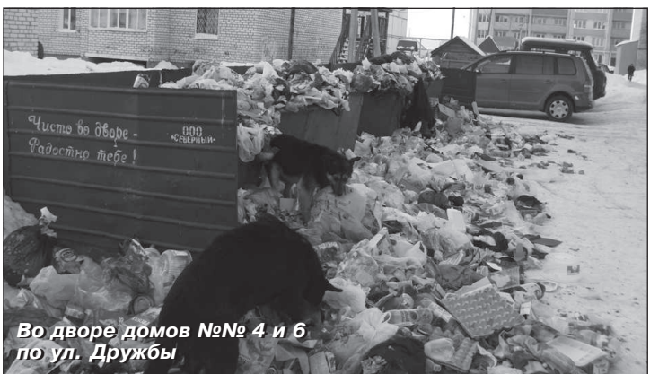
Во дворе домов №№ 4 и 6 по ул. Дружбы