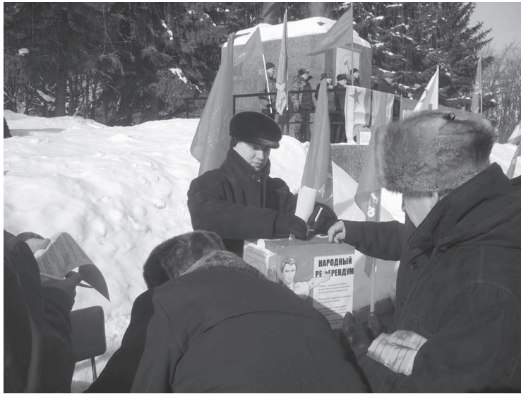
Чебоксарцы голосуют по вопросам Народного референдума КПРФ.

Вурнары. На митинге 23 февраля было проведено первое